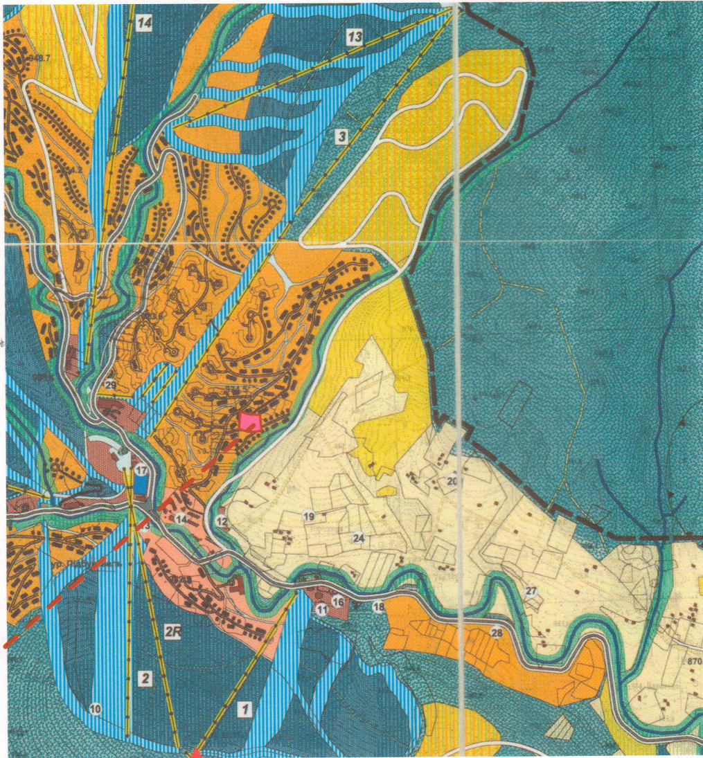
Схема розташування території у планувальній структурі села Поляниця М 1: 5 000