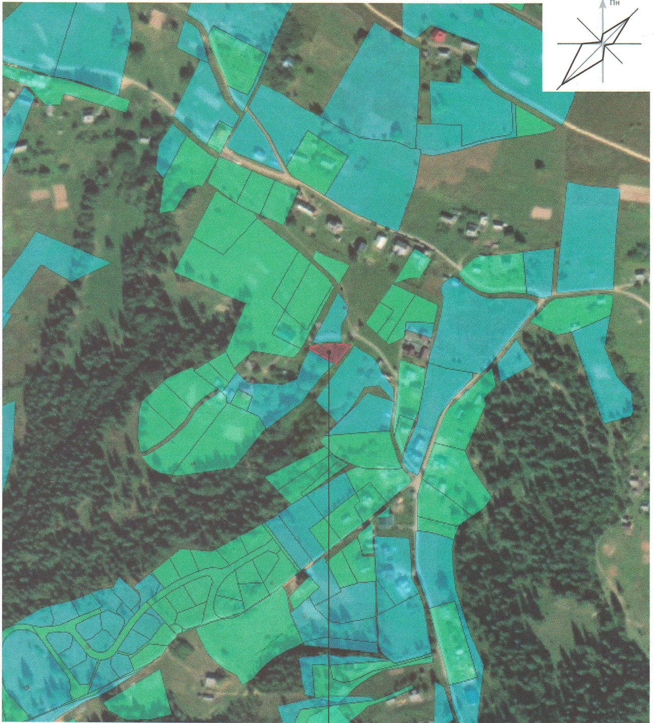
Схема розташування території у планувальній структурі населеного пункту (кадастрова карта України )

Місце розташування земельної ділянки на яку розробляється ДПТ