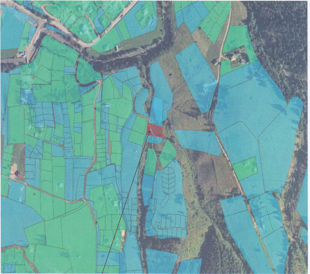
Місце розташування земельних ділянок на яку розробляється ДПТ