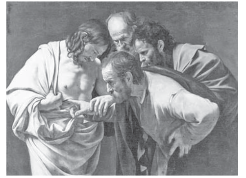
Недовірливий Тома. Караваджо. 1602 р.

У першу неділю після Великодня, яку ще називають Провідною або Томиною, ми чуємо в Євангелії від Йоана історію про переляканих учнів, що сиділи, мабуть, у тій самій горниці, де відбулася Тайна Вечеря, при замкнених дверях. Вони боялися юдеїв, які після розправи над їхнім Учителем могли прийти й по них самих. З апостолами не було Матері Ісуса, не було двох учнів – Клеопи та іншого, що втекли з Єрусалиму до Емаусу, де їх дорогою зустрів Воскреслий Господь, і апостола Томи. Петро та Йоан, правда, виходили перевірити порожній гріб Христа, але швидко повернулися. Тома виявився найсміливішим. Ще раніше, коли Ісус вирішив іти до померлого Лазаря у Витанію близько Єрусалиму, цей учень сказав: «Ходімо й ми з ним, щоб разом умерти». І зараз він не сидів у кімнаті, а, можливо, турбувався про побут та харчі для інших апостолів. Цю його сміливість було винагороджено тим, що Тома зміг торкнутися ран Ісуса Христа і ствердити Його реальність. Він зробив те, чого, можливо, хотіли, але боялися, інші апостоли. Його віра потребувала утвердження, щоб бути переконливою.