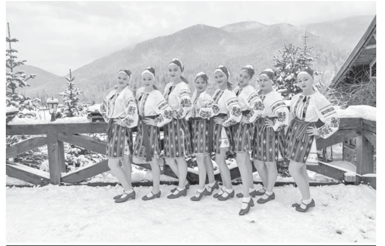
На конкурсі у Татарові

У листопаді минулого року їздили на українсько-грузинський Благодійний фестиваль-конкурс мистецтв «Wonder fest Georgia Karpaty», який відбувся у Татарові. Там посіли перше місце за виконання «Молдавської