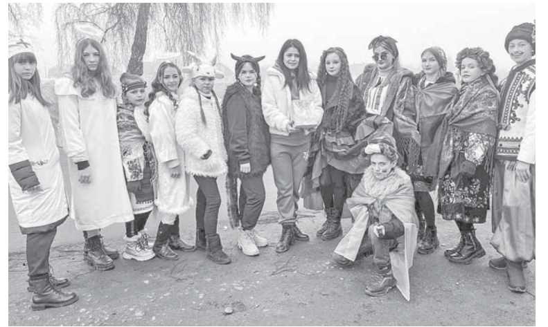
Маланка від «Калиноньки»

своїти» (середня група) і перше за «Гопачок» (молодша група). Стали також лауреатами другої премії на минулорічному танцювальному конкурсі в Червонограді. А ось у квітні нас запросили до участі у фестивалі з нагоди Дня мистецтва танцю в місті Долині. Поїздок було б іще більше, але це кошти, яких нам бракує. Адже все оплачуємо самі, включно з транспортними витратами, костюмами, пошиття яких переважно оплачують батьки наших танцюристів і т. ін.