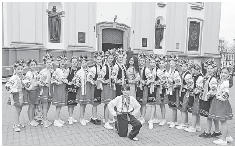
«Калинонька» на Великодніх гаївках в Івано-Франківську

– Чи бачило місто ваші танці раніше? Чи відома «Калинонька» Івано-Франківській громаді?