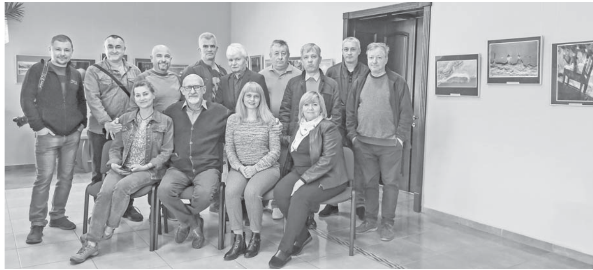
Учасники фотоклубу з відвідувачами виставки.

Podkarpatie», а далі були «Портрет», «Мистецтво мінімалізму», «Відображення та тіні», «Воскресіння». Кожна виставка почергово експонується в Польщі та Україні. Ця традиція втілюється і в найновішому спільному проєкті.