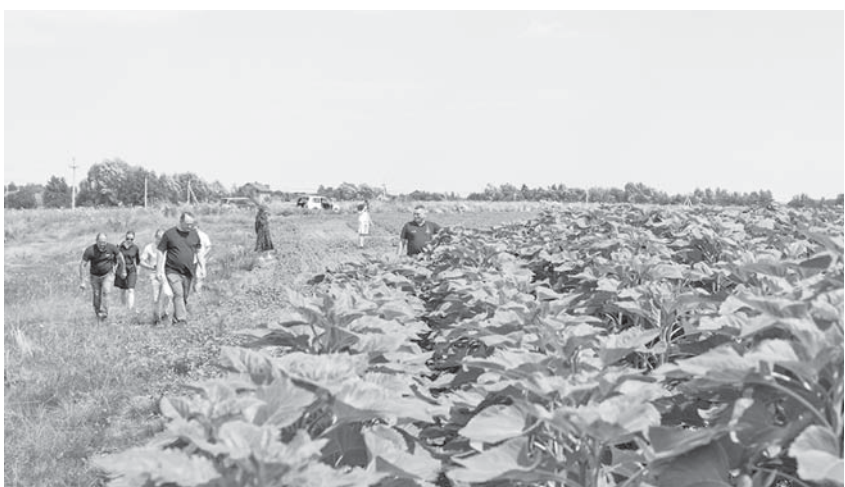
Соняшникове поле в Радчі

У селі Радча, де землі засіяно найбільше – понад 73 гектари, уже показав хороший ріст соняшник. Тут є три ділянки, засаджені комунальним підприємством. Аграрії кажуть, дощова погода у травні не надто шкодила, а лише відсунула початок посівної, бо було складно заїхати технікою на поля. Однак надалі дощі не завадять у розвитку культур, а тому КП «Франківськ-АГРО» очікує на хорошого урожаю.