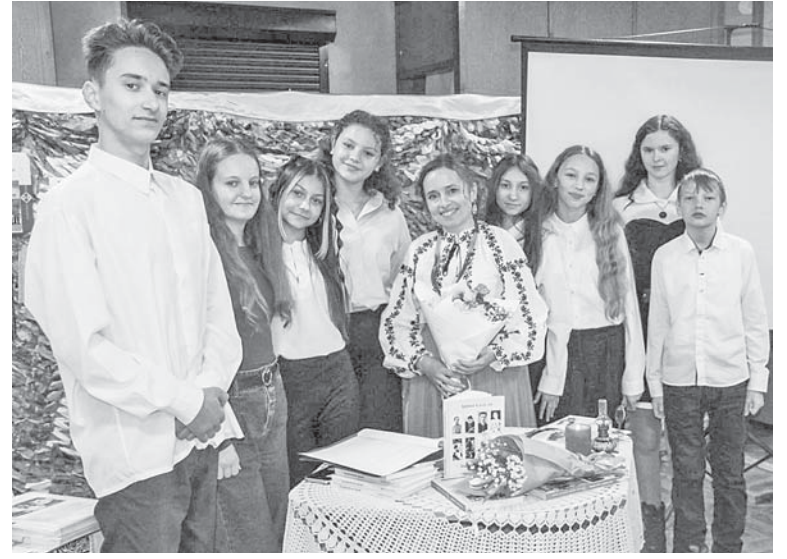
З учнями Угринівського ліцею