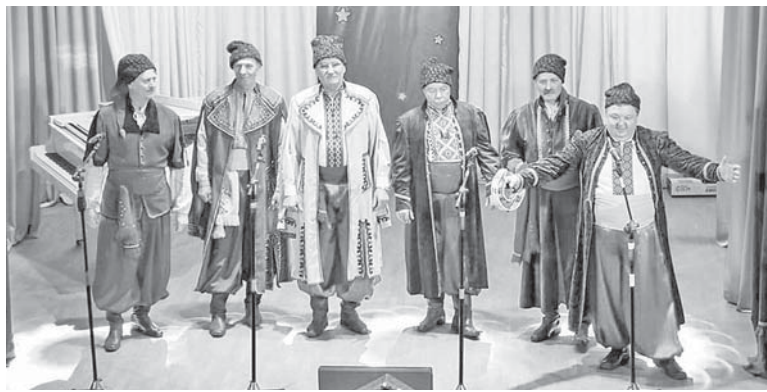
Заряджають енергією «Козаки»