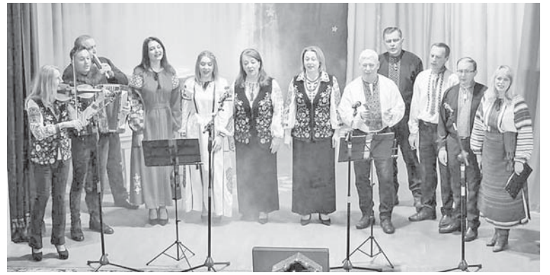
Колядує тисменицька культура