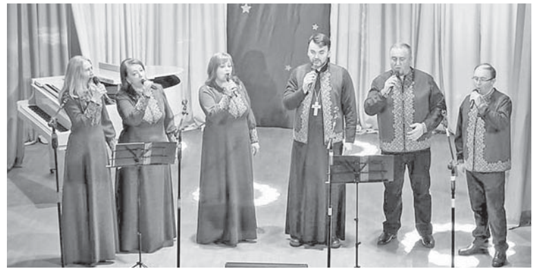
Коляда «Розкрило небо» у виконанні ансамблю «Домінанта»