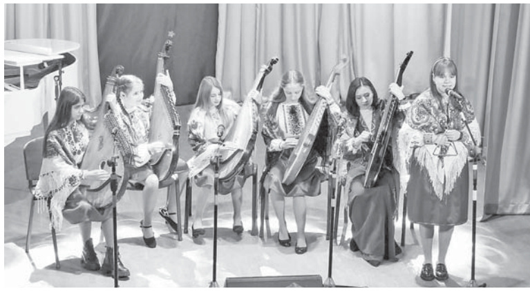
Доброго вечора бажають бандуристи