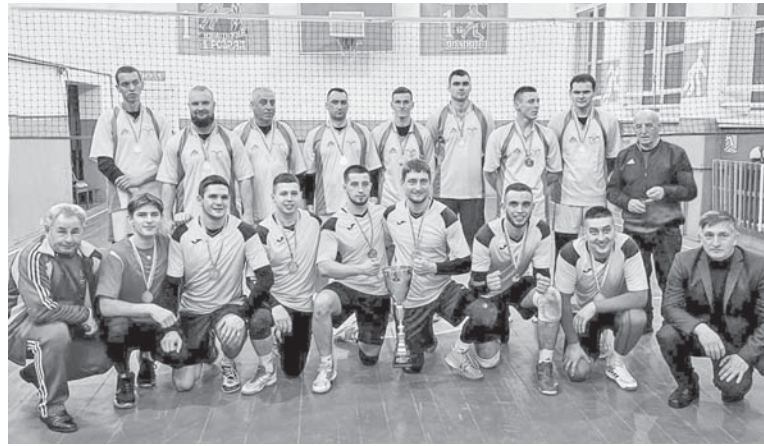
Переможці X меморіалу – команда Торговиці (нижній ряд), срібні призери – зі Старих Кривотул.